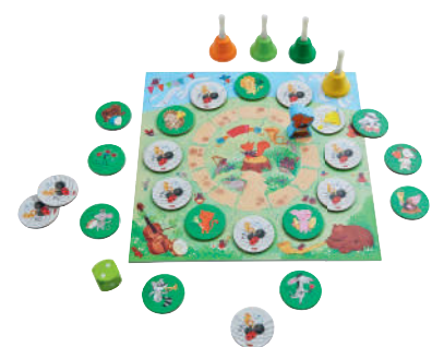
Spiel 8: Großes Tier-Konzert Ein Farben-Memo-Spiel mit Würfeln