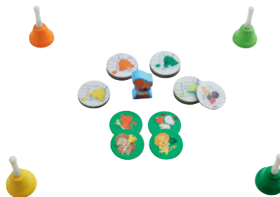
Spiel 2: Li-La-Lausche-Mäuse gesucht Ein Hören-im-Raum-Spiel