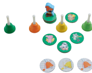
Spiel 5: Rät mal, welche Glocke das war Ein Glocken-Hör-Spiel