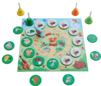
Spiel 4: Kleines Tier-Konzert Ein kooperatives Farben-Memo-Spiel