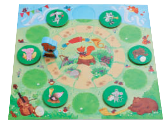
Spiel 6: Was singen die Tiere? Ein Hör-gut-zu-und-mach's-nach-Spiel