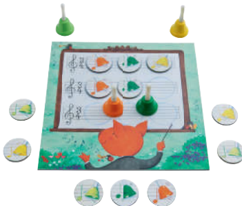
Spiel 1: Willkommen bei den Musik-Machern Ein lustiges Musik-Mit-Mach-Spiel