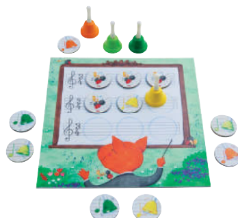
Spiel 7: Ich packe meinen Klangkoffer Ein Hör-Memo-Spiel