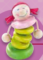
Baby & småbørn

Børn forstår verden gennem leg. HABA hjælper dem på vej med leg og egetøj, som vækker deres nysgerrighed, med fantasifulde møbler, tilbehør, smykker, gaver og meget andet. For små opdagere behøver store idéer.