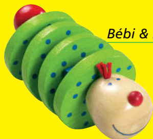
Bébi & kisgyermekjátékok