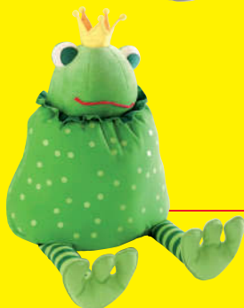
Διακόσμηση παιδικού δωματίου

Τα παιδιά μαθαίνουν τα πάντα για τον κόσμο παίζοντας.