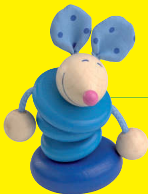
Baby & småbarn